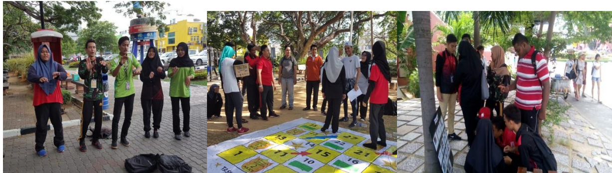
Aktiviti Explore race dan stationgames bersama pelajar PMK dan POLBENG

5 orang Pelajar Politeknik Negeri Bengkalis(POLBENG) menjalankan latihan industri di PMK selama 1 bulan