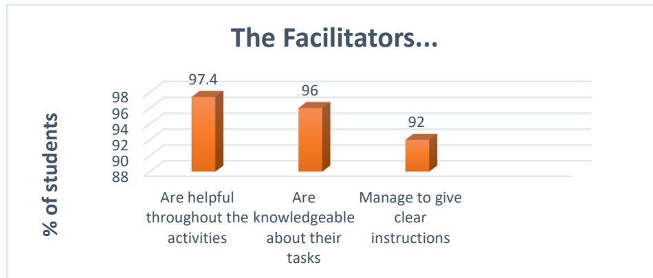
Graf 3.1 : Fasilitator

Graf 3.1 menunjukkan bahawa sebanyak 97.4 % responden mengatakan bahawa fasilitator adalah sangat membantu sepanjang aktiviti dijalankan. 96% dari responden pula mengatakan bahawa fasilitator adalah berpengetahuan tentang tugas yang dilakukan. Mereka ini juga mampu memberi arahan yang jelas. Ini dinyatakan oleh responden sebanyak 92 %.